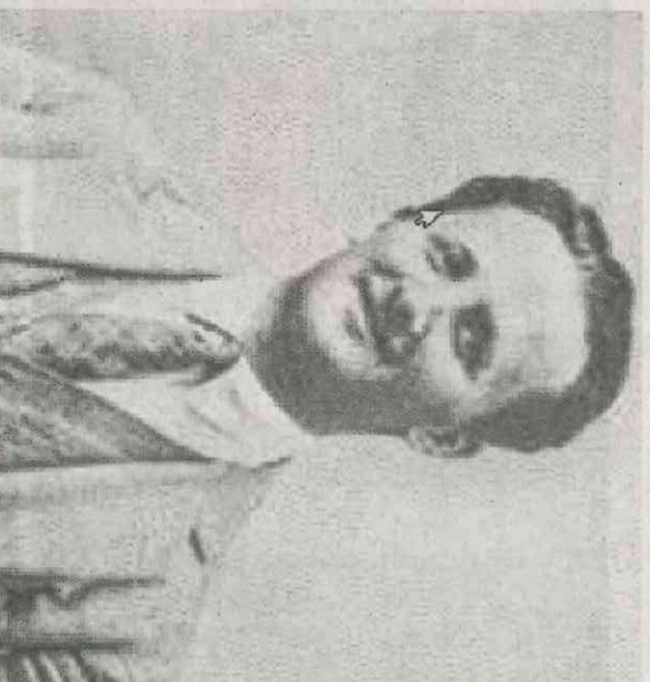
Voilà 82 ans, Carlo et Nello Rosselli ont perdu la vie car ils s'étaient élevés contre le fascisme.